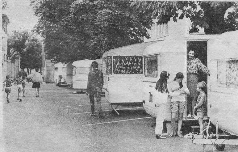
Une partie de la concentration caravaning, dans la Cour du Lycée Technique.

Les délégués demanderont aussi que les classes soient de quinze élèves et ils se prononceront contre l'école-caserne.